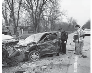
Подготовила Ирэна ШКЕЖЕВА