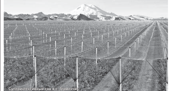
Суперинтенсивный сад в с. Герменчик

Аграрии Урванского района несмотря на вызовы засухи лета прошлого года и COVID-19 сумели завершить минувший сельскохозяйственный сезон достаточно результативно.