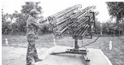
Новая точка защиты от града в Баксанском районе

Кабардино-Балкария относится к зоне рискованного земледелия. В числе серьёзных проблем в сфере растениеводства – защита посевов от града.