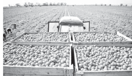
Урожай томатов арендаторов с Чёрной Речка 2020 г.

Пищевая и перерабатывающая промышленность является одной из важнейших отраслей агропромышленного комплекса района. В целом по району в 2020 году предприятиями отрасли произведено 122 миллиона 354 тыс. условных банок консервной продукции. – Основной объём консервной продукции не только района, но и республики производит «Агро Инвест» (г. Нарткала): в истекшем году выработано более 118 миллионов условных банок консервов на общую сумму свыше одного миллиарда 348 миллионов рублей. Также достаточно результативно поработали в прошлом году отраслевые предприятия, расположенные в Урванском районе. – «Агро-07», крестьянское (фермерское) хозяйство «Сибекхов», индивидуальный предприниматель Сибеков А.Ж., которые в общей сложности произвели консервной продукции около 4 миллионов 320 тысяч условных банок. В эти дни в районе идут полные