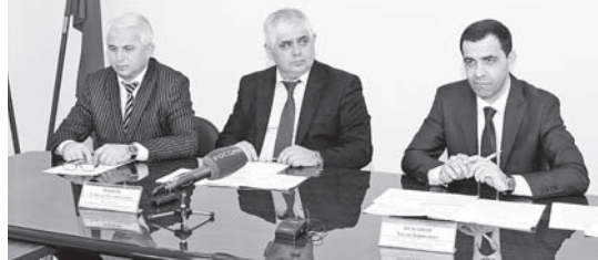
(Окончание. Начало на 1-й с.)

Об уже проведённых и планируемых работах в рамках проекта «Общественные меры развития дорожного хозяйства» в числе прочего подразумевает увеличение числа контрактов, предусматривающих применение новейших технологий и материалов. В Кабардино-Балкарии уже на двадцать одном объекте применены эти технологии и использованы материалы, благодаря которым улучшается сцепление на дороге, увеличивается прочность покрытия и повышаются его водоотталкивающие свойства. В их числе – первый сантехнический надрокрут в этом году объект – участок дороги «Нарткала – Урвань – Рыболитник». Увеличилось также и число контрактов, заключаемых на принципах жизненного цикла, что позволяет подрядчикам получать финансирование не только на выполнение дорожных работ, но и на содержание объекта, своевременно подбирать технику и закупать материалы, лучше сконцентрироваться на качестве ремонта.