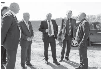
Земель сельхозназначения, пригодная для орошения, составляет 130 тысяч гектаров, или 46% от общей площади пахотных угодий республики.

Реализация мероприятий в области мелиорации в республике осуществляется в рамках регионального проекта «Экспорт продукции АПК» и ведомственной программы «Развитие мелиоративного комплекса России». В 2019-2020 годах введено в эксплуатацию 16,5 тыс. гектаров орошаемых земель. Объем государственной поддержки за два года составил 978,6 млн рублей. Площади