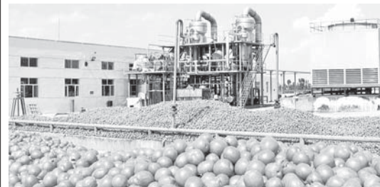
ООО «Агро-Инвест», Урванский район

Порядка 350 миллионов условных банок продукции прогнозируют выработать предприятия консервной промышленности Кабардино-Балкарии в 2021 году.