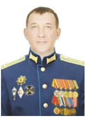
молодые люди изъявляют желание отправиться на службу в армию?

– Призыв на военную службу весной 2021 года, как и предыдущие два призыва прошлого года, проводится с учётом рисков, связанных с угрозой распространения коронавируса, что влечёт за собой необходимость внедрения новых, нестандартных методов проведения призывных мероприятий. Такой опыт у нас есть, и мы будем его использовать и совершенствовать. Потоки прибывающих в военные комиссариаты молодых людей будут разделены с учётом минимизации контактов с посетителями. Военные комиссариаты муниципальных образований обеспечены необходимым медицинским имуществом: масками, перчатками, бактерицидными лампами и дезинфицирующими средствами. Кроме того, как и раньше, при