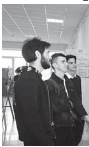
В колледже дизайнера Кабардино-Балкарского государственного университета им. Х.М. Бербекова состоялась выставка работ воспитанников детской школы искусств г. Баксана.

Выставка является важным и давно ожидаемым событием как для колледжа, так и для воспитанников ДШИ, поскольку именно они являются потенциальными студентами творческого учреждения. На открытии было отмечено, что специалисты в области дизайна на сегодняшний день востребованы не меньше, чем специалисты IT-сферы. Воображение и генерация идей, собственные творческие мысли, являются уникальными способностями, спрос на которые будет высоким и перспективным. Функциональность, гармоничность, красота – все, что требует от человека современного мира, объединено в специальности дизайнера.