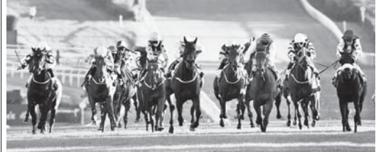
Завтра на нальчикском ипподроме очередной скаковой день, центральным событием которого является розыгрыш традиционного приза первой группы «Большой Летний» на лошадях трёх лет чистокровной верховой породы на дистанции 1600 метров.

В борьбе за этот престижный трофей выступят пять претендентов на победу в ипподроме гнёдного Эрлена. Среди них - гнедая Линк Аир, Социна, оставшаяся за Линк Аир второй в призе «Пробный». Главные «облоды» для скаковых гурманов - призь Эльты Х. Кудиева. Кто выиграет - это решать скакатики. В пятницу в 10.00 на ипподроме гнёдного Эрлена пройдёт скакание. Завтра в 12.00 на ипподроме гнёдного Эрлена пройдёт скакание. Завтра в 12.00 на ипподроме гнёдного Эрлена пройдёт скакание. Завтра в 12.00 на ипподроме гнёдного Эрлена пройдёт скакание.