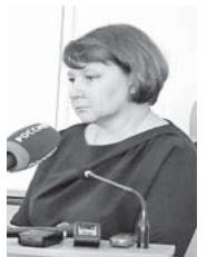
Также не проводилась независимая оценка качества условий оказания услуг организациями социального обслуживания – они приняли в ней участие в 2018 и 2019 годах.

В 2020 году независимая оценка качества услуг в сферах здравоохранения не проводилась в связи со сложившейся ситуацией эпидемиологической обстановки и введёнными ограничениями по допуску в помещения медицинских организаций посетителями, не имеющим отношение к получению или оказанию медицинской помощи.