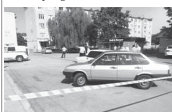
В СУ СК РФ по КБР инициирована доследственная проверка по факту ДТП в Тереке.

По предварительным данным, 30-летний водитель не справился с управлением и допустил наезд на двух женщин.