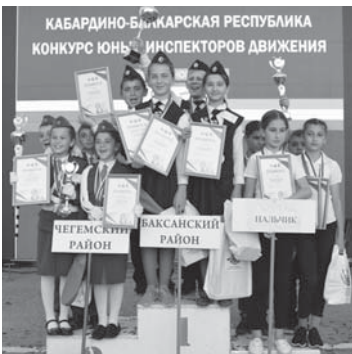
КАБАРДИНО-БАЛКАРСКАЯ РЕСПУБЛИКА КОНКУРС ЮНЬ И ИНСПЕКТОРОВ ДВИЖЕНИЯ

За активное участие в развитии добровольного объединения учащихся «Юный инспектор движения».