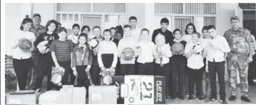
Росгвардейцы подарили детям развивающие настольные игры и спортивный инвентарь.

В Международный день защиты детей военнослужащие и сотрудники Управления Росгвардии по КБР посетили школу-интернат в Законовом для детей-сирот и детей, оставшихся без попечения родителей.