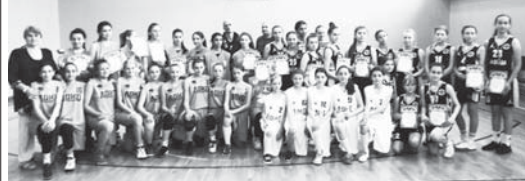
В спорткомплексе «Кристалл» прошёл межрегиональный юношеский турнир по баскетболу, посвящённый Международному дню защиты детей.

В турнире приняли участие команды юношей и девушек из Туапсе, Владикавказа и Нальчика.