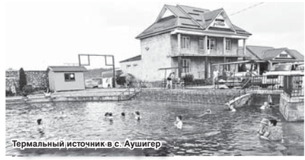
Термальный источник в с. Аушигер