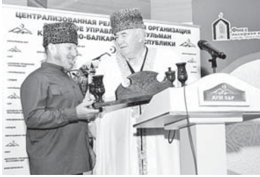
Централизованная религиозная организация «Исламский центр «Исламский центр «Исламский центр»

Исполнилось тридцать лет со дня основания Духовного управления мусульман Кабардино-Балкарской Республики. Поздравить мусульманскую умму КБР с юбилейной датой в Нальчике приехали делегаты ДУМ республик СКФО, а также ЮФО.