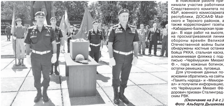
Окончание на 2-й с.