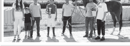
Победительница Феври 1954 года кобыла Аргава выиграла Большой приз для кобыл двух лет в возрасте четырёх лет, установив рекорд – 1 минуту 49,5 секунды. Поэтому неслучайно её именем назван приз для трёхлетних кобыл на дистанции 1800 м.