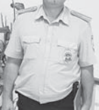
Скандалы, семейные неурядицы, жилищные проблемы, постоянный контроль за «нехорошими» домами и неблагополучными гражданами, реагирование на побои и угрозы жизни - это лишь малая часть работы, с которой сталкиваются участковые уполномоченные полиции. Именно они первыми прибывают на место происшествия, и они же первыми встают на защиту прав граждан. Жители с Чегем-2 благодарят за

Участковых уполномоченных чаще всего называют «народными» полицейскими. Они круглосуточно работают на закрепленной территории и ближе всего к месту происшествия. Проводят не только профилактические работы, но и принимают участие в уголовных и административных расследованиях.