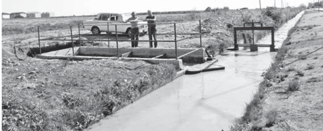
Блага на поля по сберегающей технологии

В народном предприятии «Шэджэм» (г. Чегем) реализовали уникальный проект по подаче воды на поля, в основу которого положена ресурсосберегающая технология.