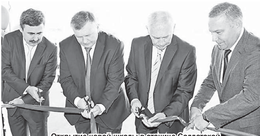
Открытие новой школы в станице Солдатской