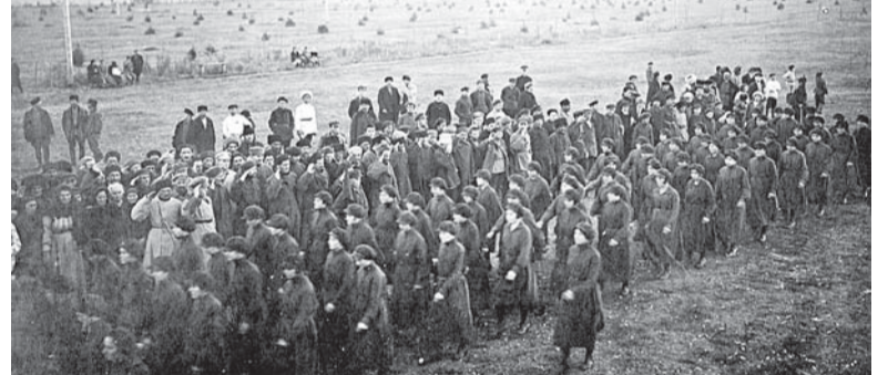
Курсанты Ленинского учебного городка

Первую круглую дату – пять лет со дня образования Кабардино-Балкарии – праздновали в непростое время. Середина двадцатых годов прошлого столетия была периодом, когда новый строй только набирал силу, немало было ещё и его противников, не было и опытных управленцев. Всё делалось методом проб и ошибок, которых тоже, к сожалению, было немало. «Путь, пройденный областью за пять лет, был нелёгкий, покрытый терниями многих страданий и переживаний, – в стиле того времени писала передовица на первой полосе нашей газеты (в то время называвшейся «Карахалк»). – Годол, ряд неурожайных лет, упадок сельского хозяйства, общая хозяйственная и культурная отсталость как прямое следствие царского владычества стоили грозным призраком на пути творческо-созидательной работы молодой автономной области. Область, пережившая все бедствия, преодолевшая неслыханные трудности, сумела не только защититься,