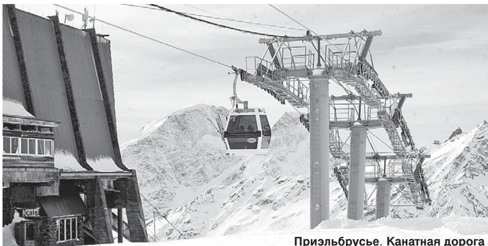
Приэльбрусье. Канатная дорога

стратегически определиться, куда двигаться. Турпоток, который мы сегодня имеем, а мы сравниваем с последним удачным годом, 2019-м, – по данным за полугодие, у нас получился рост 46 процентов год к году.