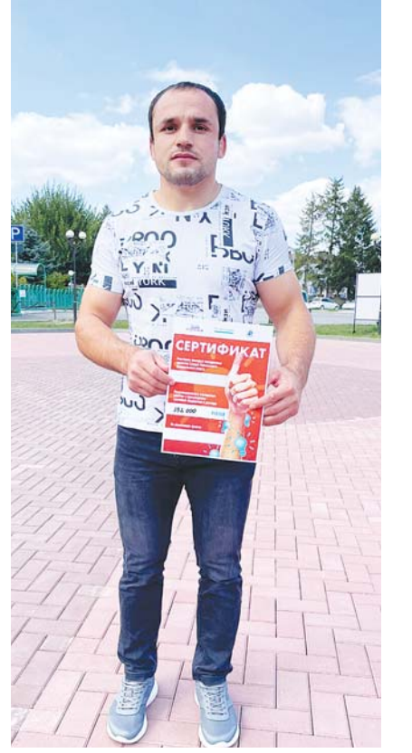
Работы по подготовке основания спортивной площадки планируется провести до конца года. Она будет расположена в центре села неподалёку от школы.

Согласно условиям конкурса Росмолодёжь проект должен быть реализован до августа 2022 года.