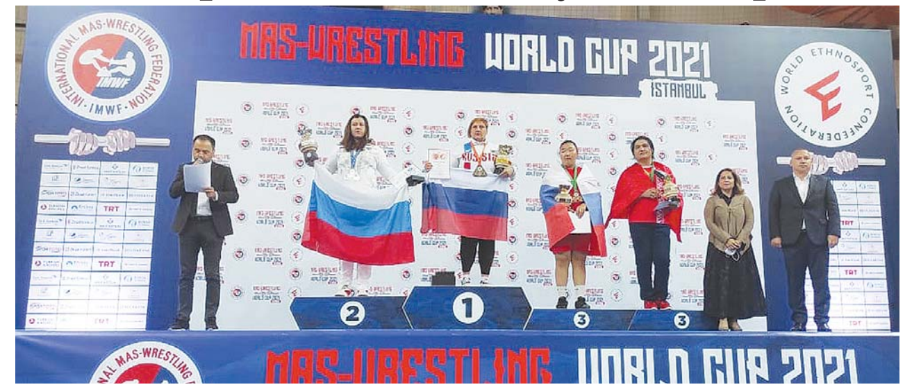
Материалы рубрики подготовил Альберт ДЫШЕКОВ

В минувшие выходные в турецком Стамбуле в рамках Всемирной конфедерации этноспорта @ethnospor прошёл второй этап Кубка мира по мас-рестлингу, в котором участвовали около 200 спортсменов из 11 стран.