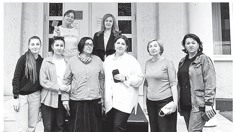
Команда профессионалов Россельхозцентра по КБР

В республике высеваются сорта озимых культур, которые уже на протяжении долгого времени возделываются сельхозпроизводителями региона, зарекомендовавшие себя положительно, с высокой продуктивностью, хо-