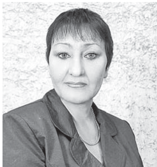
Р.М. Тубаева, нар. арт. КБР