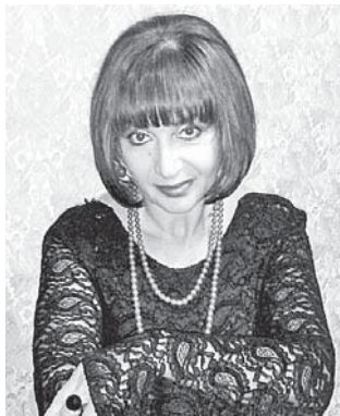
Р.А. Кулахметова, засл. арт. КБР