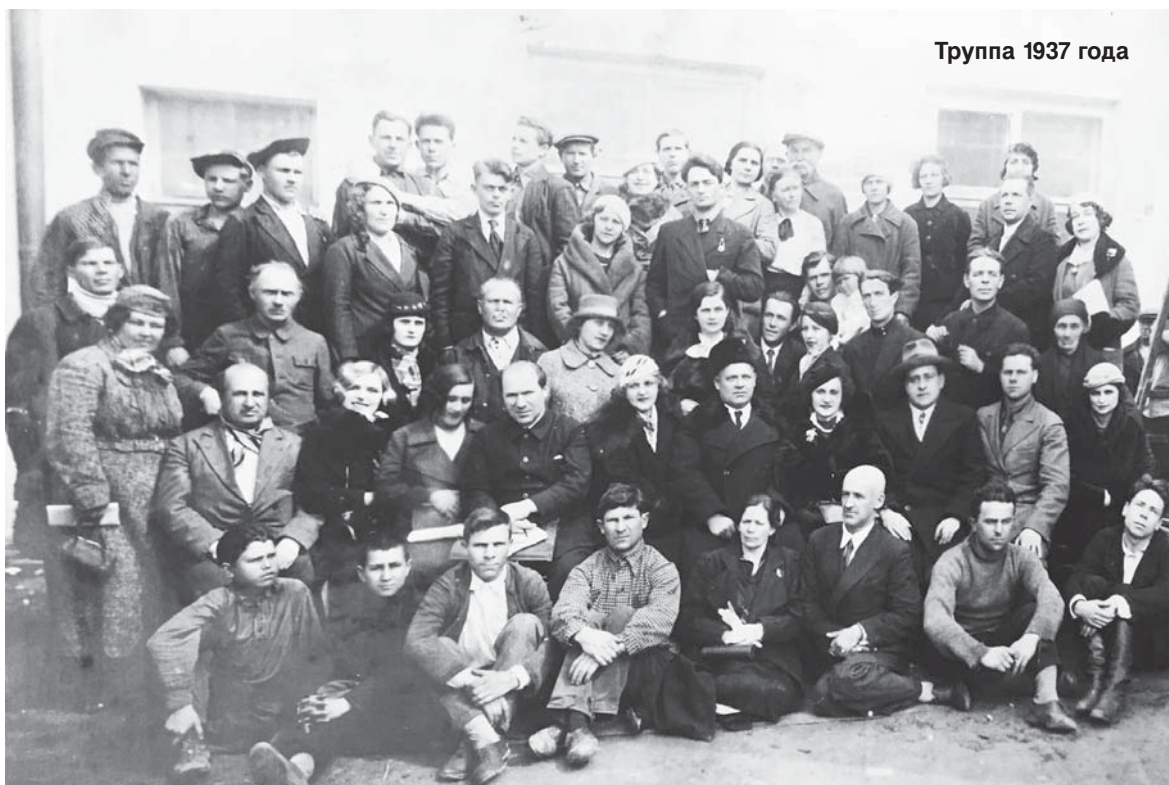
Труппа 1937 года