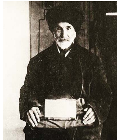
Основоположник кабардинской литературы Бекмурза Пачев

партийный и государственный деятель, председатель Президиума Верховного Совета КБАССР в 1967–1979 гг., народный поэт КБАССР.