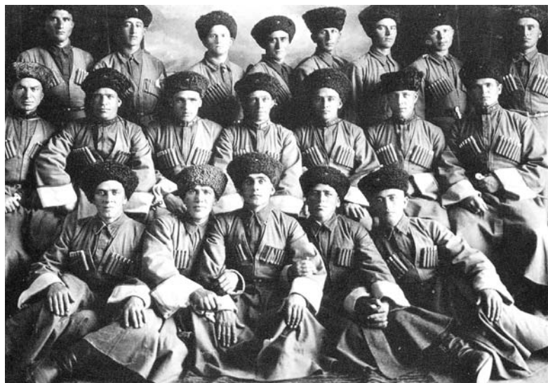
Воины 115-й кавалерийской дивизии