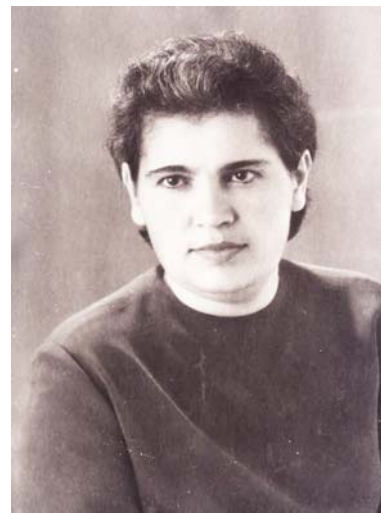
Государственный и общественный деятель КБАССР Фаина Арсаева