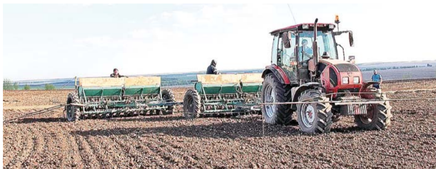
Сев озимых в Терском районе, ноябрь 2021 г.

Каждый погожий осенний день приближает аграриев Кабардино-Балкарии к завершению озимого сева – кампании, от которой напрямую зависит, насколько прочной будет основа будущего урожая.