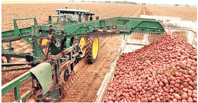
Сбор нового урожая в агрофирме «Зольский картофель»

По оперативной информации органов управления АПК муниципальных районов и городских округов, в текущем сельскохозяйственном году в целом по республике под картофель было отведено около 690 гектаров.