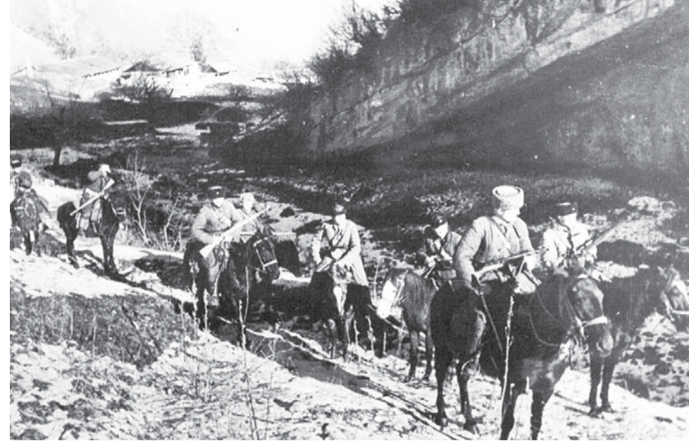
Отряд партизан выходит на боевое задание, Кабардино-Балкарская АССР, 1942 г.

80 лет назад в Кабардино-Балкарии началась организация партизанских отрядов. Согласно постановлению Нальчикского комитета обороны от 24 ноября 1941 года в республике подбирались руководящий состав, утверждались места базирования и районы боевых действий партизанских отрядов, закладывались тайные продовольственные базы.