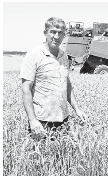
Богатый урожай пшеницы лескенских аграриев в 2021 г.

Из 52 306 гектаров общей площади земель района земли сельскохозяйственного значения составляют примерно половину – 26 665 гектаров, в том числе 12 704 га пашни. В АПК района функционирует 12 сельскохозяйственных предприятий, 44 крестьянских (фермерских) хозяйства, 34 малых и средних предприятия, 825 арендаторов. В 2020 году ими было произведено продукции на 5 миллиардов 128 миллионов рублей.