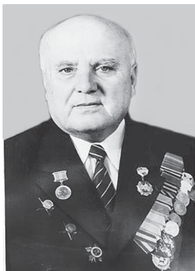
(Окончание. Начало на 3-й с.) Аскерби Тахирович Шортанов

– писатель, заслуженный деятель искусств РСФСР и Кабардино-Балкарской АССР, первый кабардинский романист и кандидат искусствоведения Северного Кавказа, известный учёный-фольклорист. В 1936 г. окончил ГИТИС.