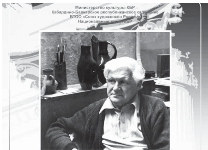
Проект «Мастерская духовности» выставка

председателя Союза художников КБР. «Дыханием эпохи» называют чувство, исходящее от его произведений, написанных на основе этюдов, созданных в путешествиях по Кабардино-Балкарии, Дагестану, Средней Азии и городам России. К сожалению, рисунки, созданные непосредственно в военное время, зарисовки боевых товарищей во время передышек между боями не сохранились. Работы, находящиеся в планшете, были уничтожены взрывом во время очередного сражения. Однако глубокий психологизм последующих произведений, отражающих