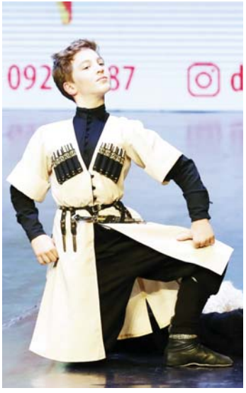
Солист ансамбля «Черкес»

Декабрь принёс успех нескольким детским танцевальным коллективам из нашей республики. Ансамбли из Нальчика «Шагди», «Асса», «Черкес» и танцевальный коллектив из Нарткалы «Дыгъшыр» на днях получили признание на хореографических конкурсах разного уровня.