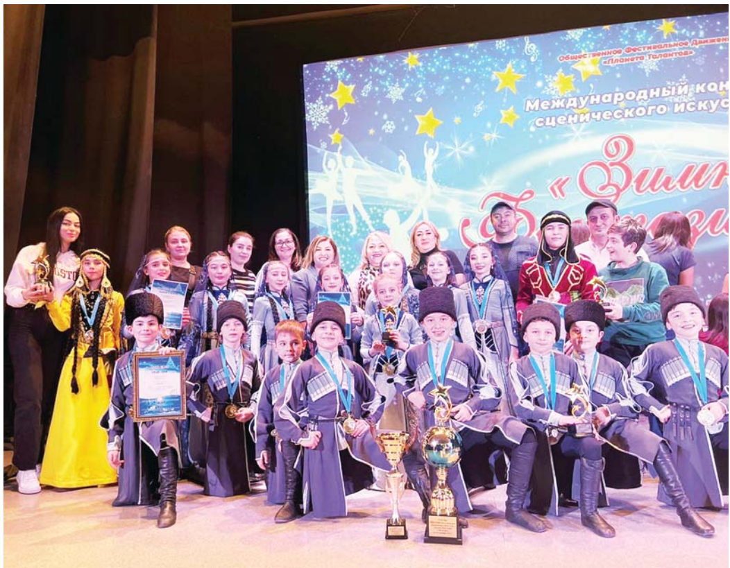
Народный ансамбль танца «Шагди»

состоялся международный конкурс сценического искусства «Зимняя фантазия». И здесь юных артистов из ансамбля «Шагди» ждал успех – гран-при и три пер-