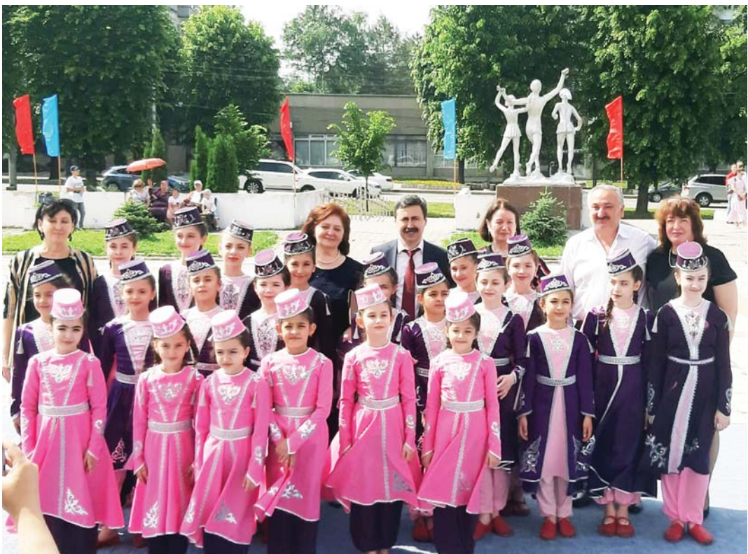
Ансамбль народного танца «Асса»

Успех всех наших танцевальных коллективов стал достойным завершением творческого года и стимулом для новых сценических побед.