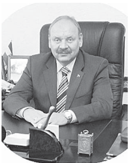
Он родился в Средней Азии. В 1944 году весь его род был депортирован в Киргизию.