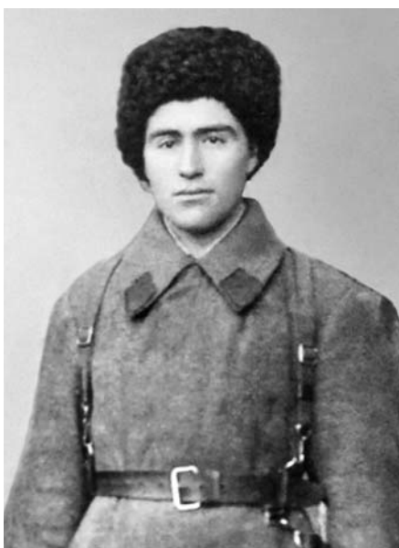
Жашуулары Биясланны жашы Хусей