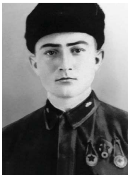
Жашуулары Омарны жашы Магомет