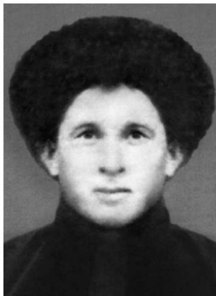
Жашуулары Аммекни жашы Хусей