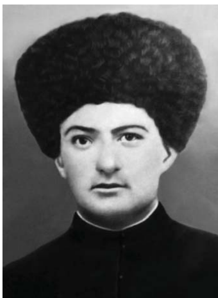
Жашуулары Исмайылны жашы Магомет