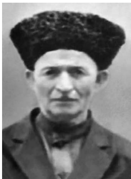
Жашуулары Кесуанны жашы Исхакъ