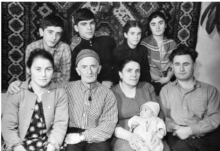
Шахмырзаланы Саид юйюрю бла