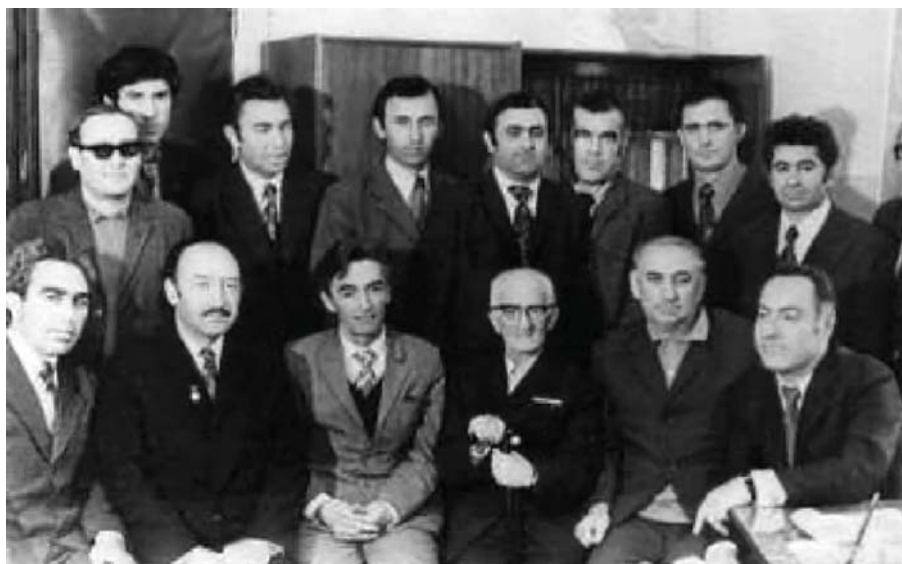
Шахмырзаланы Саид жазычула бла