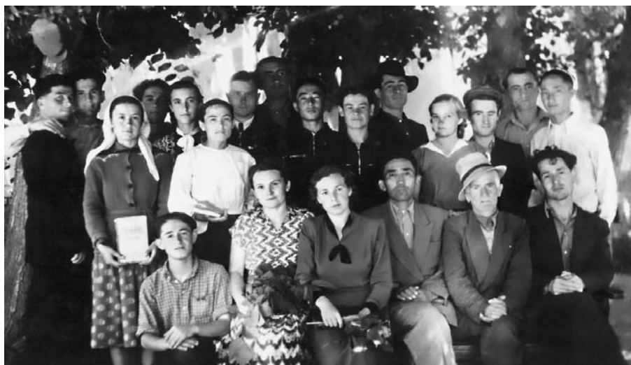
Шахмырзаланы Саид студентле бла