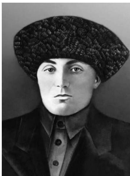
Жашуулары Жунканы жашы Хамит