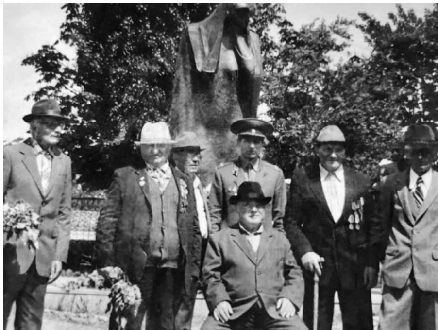
Яникой элни ветеранлары