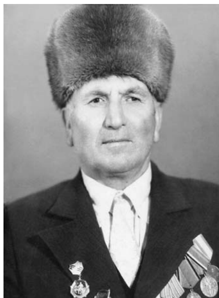
Гюрғокъланы Азнорну жашы Татыука