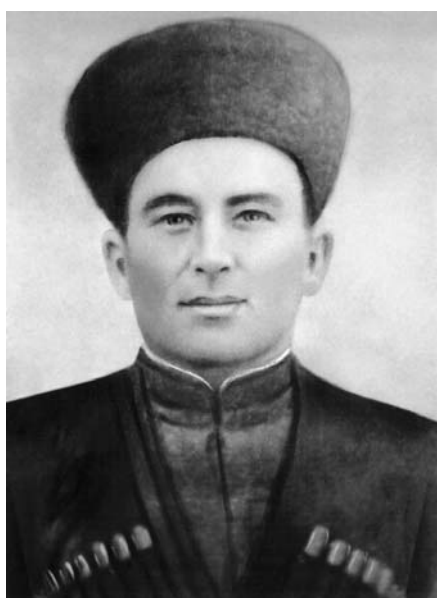
Шауталаны Зашануну жашы Мазан