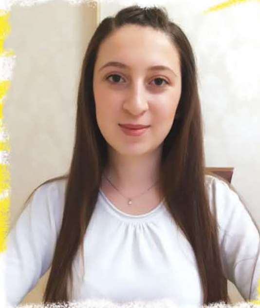
Иджыпсту КъБКъУ-м химиемкӀэ и къудамэм ехъулӀэныгъэ иӀэу щоджэ, 3-нэ курси