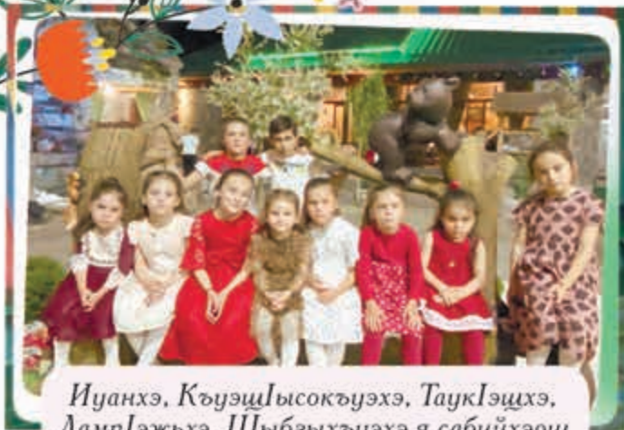
Иуанхэ, Къуэщысокъуэхэ, ТаукIэцхэ, ЛампIэжьхэ, Шыбзыхъуэхэ я сабийхэрц