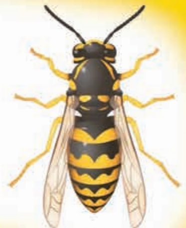
хьэдзыгъуанэшхуэ (большая оса)