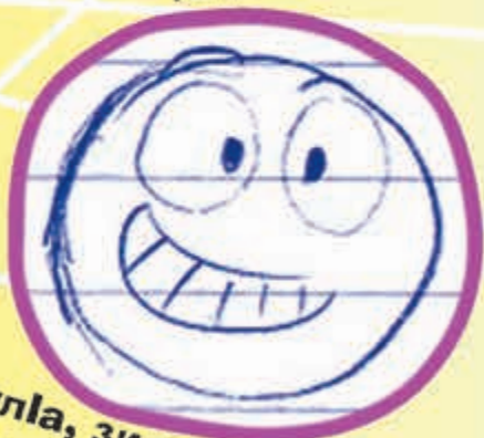
ехула, зи насып кыхьа