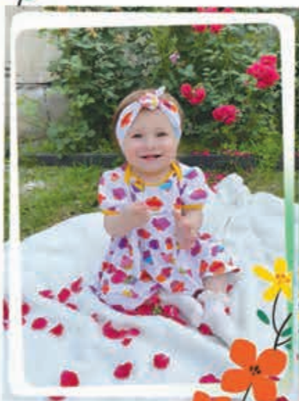
Къашырггээ Дисанэ, 1 илгээс