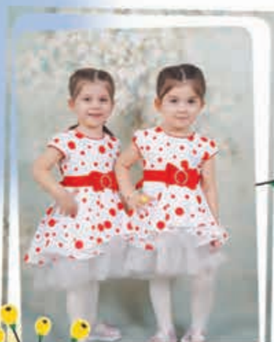
Соблырхэ Алинэрэ Каролинэрэ, илгээси 4