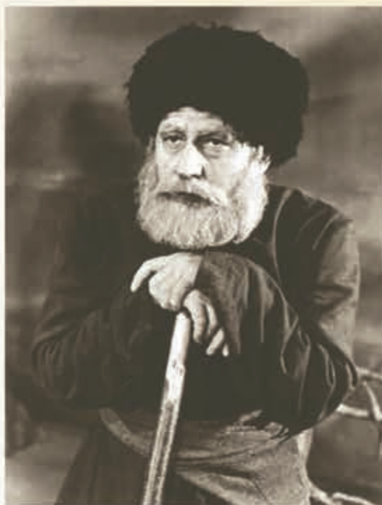
Бачиланы Ахмат «Азап жол» деген оюнда Кязимни сыфатында

Бачиланы жашларыны хореограф, режиссёр фахмусун да айтмай болмайма. «Жол беригиз! Къарамырза къатын