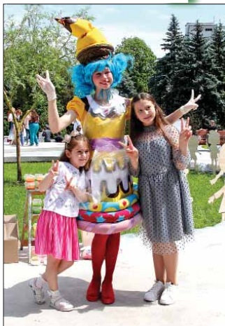
Начало стр. 1

Концерты, выставки, мастер-классы и не только. В Нальчике благотворительные акции, игры, конкурсы, викторины, блиц-турниры, показательные выступления юных спортсменов прошли в парках и скверах, а также на территории общественных пространств, благоустроенных в рамках программы по формированию современной городской среды. Это Атажукинский сад, включая центральную и липовую аллеи, городок аттракционов, новые скверы за Домом Правительства, по улице