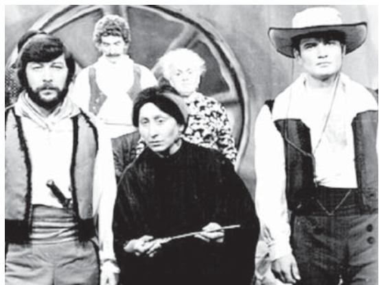
Г.Лорка. «Къанлы той».