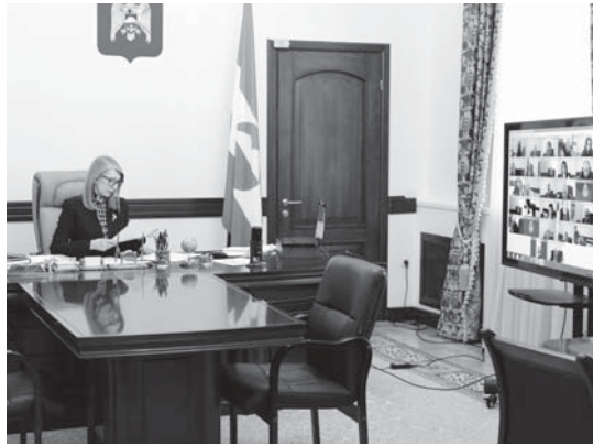
юсюнден» федерал законнга, КъМР-ни Парламентини Болумуна тийишлиликде жылны ичинде биринчи жыйылыгыа законла чыгарыуучу органнга кирмеген политика партиялары келечилери чакырылгъанларын эсертгенди.