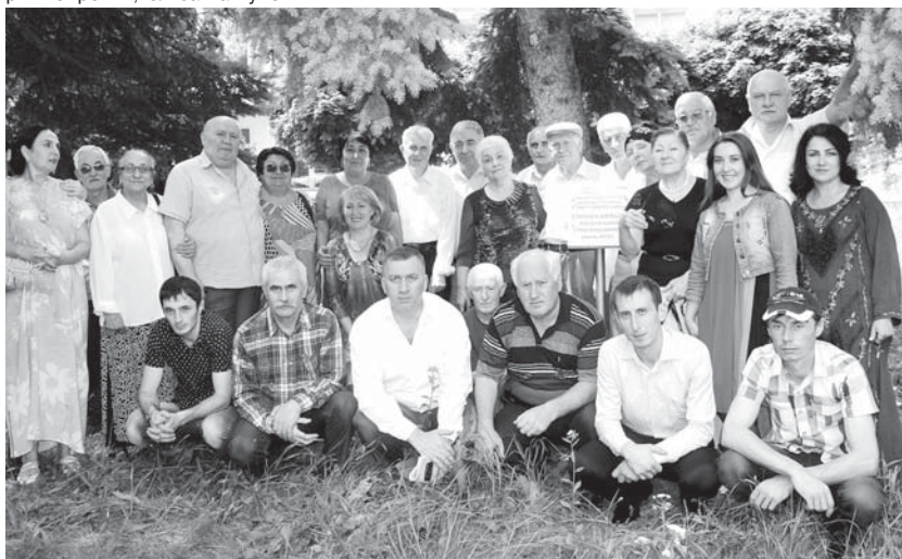
Театры актёрлары журналист-ле бла бирге.