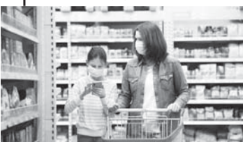
толу информация болгурга тийишлери. Он санда ким болганы, телефон номери, адреси, Дагыда автомат кылай ишлегенин, товар берилмеген эсе, ачканы кылай кыайтарыгъа болгуну юсонден информация да. Отулк къайтары станция-

Бу айны биринчисинден башлап Россияде товарланы розницада сатыу бла байламлы жаны жорукла кийрилгендиле. Алгачкыра энди токенде аберлени суратха тошюрюрге эркинлик берилди. Сатычу уа алычуну соруларуна жуу-ап берирге борчолду. Товар автомата сатыла эсе, аны юсонде ачканы артка кылай кыайтарыгъа болгуну юсонден да жазылырга керекди, деп билдиргендиле Роспотребнадзордан.