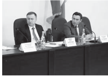
Миллиард 895 миллион сомга жетгенди республиканы инсанларына сатылгъан аш-суу багысы. Ол а 2020 жылда бу кезиуде тарихледен 0,4 проценттен астамды. Непродуктовольный товарланы багысы 10 миллиард 810 миллион сом болганды. Министр быыл сатыу-