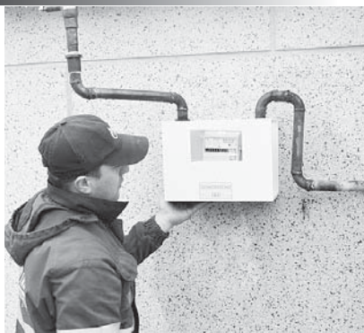
компанияны адамлары счётчикге пломбала салсала, алгынча төлеп башларгъа боллукъду. Аны себепли бу ишни болжалына салмай этерге тийшлиди. Эм биринчиден ол абонентни кесине керекди.

Заманы жете тургъан приборлары болгъан абонентлеге аны юсюнден аллындан окъуна билдирип башлайдыла. Ала уа кёпге созмай абонент службагъа барып, ишин этерча заявление жазаргъа керекдиле. Алай этилмей къалса, компанияда былай приборну кёрдюрюулерин аллыкъ туюндюле. Газны багъасын а нормативге кёре тергерикдиле. Проверка этилип,