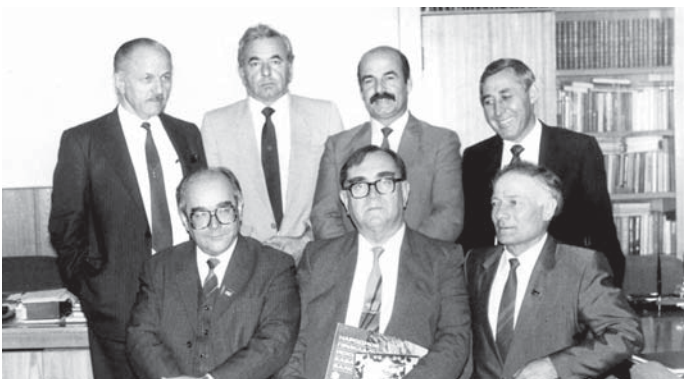
«Родина» обществада кыонакыла бла.

улуу жыйылыулада эсде кыалган докладла этгенди. Аны бир ышанын энчи сагынадыла таныгъанла – кеси окыурга сюйгенча, башхала да билимли болуларын излегенди. Бютюнда эл мюлк, экономика, финансла жаны бла, республикада жашау кыолайны айнытырча.