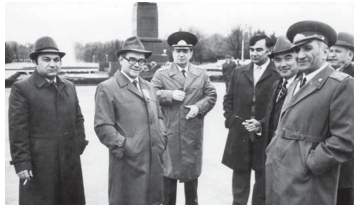
Кырал кыулукчула бла.