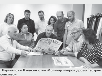
Кыууиланы Кыайсын атлы Малкыар кырал драма театры артистери.

Сыйлы жамауат! «Заман» - миллетибизни жангыз газетиди. Аны бетлеринде малкыар халкыны культуурасыны, тарыхыны, бюгоннюгю жашаууну, айтхылык адамларыны, жетишимленген эмда жартыуларыны юсюнден басмаланган материаланы сиз бир башка изданиада табалык тейлюкчюз. Алайды да, жазылыгыз, билеклик этигиз кескигниз газетигизге! Мындан ары да ол сизни керти шөхүтүгүз, огурлу сөз негеригиз болуп деп ышанабыз.