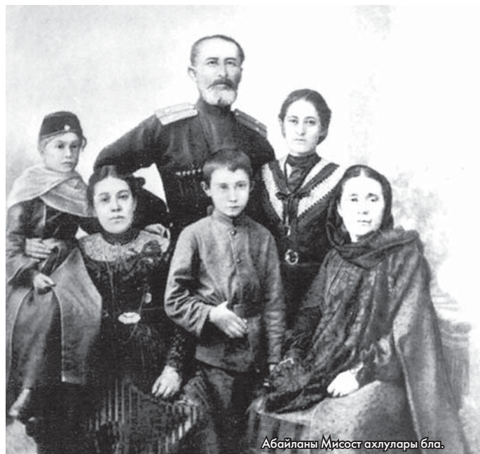
Абайланы Мисост ахлулары бла.

Быйыл Абайланы Мисостну «Балкария» деген тарых очерки басмадан чыкканы 110 жыл болады. Сау ёмюр ётгенде да, анда салынган сорууланы магъаналары кетмегенди.