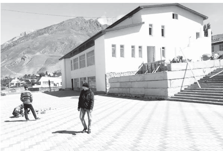
Жангыртылгъан маданият юй.