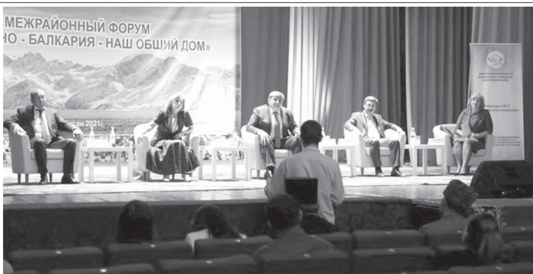
МЕХРАЙОННЫЙ ФОРУМ Ю - БАЛКАРИЯ - НАШ ОБЩИЙ ДОМ

бла ангылаулыкны саклауда себеплиги», «Муниципал даражада кырал эм миллет политиканы бардырыуда право бла байламлы аспекте эм терроризм ниетлеге къажуу туруу» эм «Кѳп тюрлюлюкню бирлиги». Аланы чеклеринде тюбешиуле, «тѳгерек столла» эм культура бла байламлы жыйылыула да ѳтгендиле. КъМР-ни Башчысы Казбек Кокков форумда ишлеген секцияларыны барында да болганды. Ол аланы хар биринде да республикада жашаган миллетлени эм дин келечилени арасында байламлыкыга аслам эс бурулуга кереклисин белгилегенди. Динни юсюнден айта, Россейни эм республиканы Конституцияларында хар инсан юйген динин тутурга эркин этилгенни эсге салганды. Бююнлюкде Россей тире айнаы барады, болсада ол шартны бир-бир тыш кыраллада артык жаратмайдыла. Аны ючюн миллетлени бир бирге ѳч этерге кюрешедиле, ол санда Шимал Кавказда да. Аны ючюн власть органла, дин биригиуле да жаш тѳлюге республикада жашаганланы арасында ангылаулык, бирлик бо-