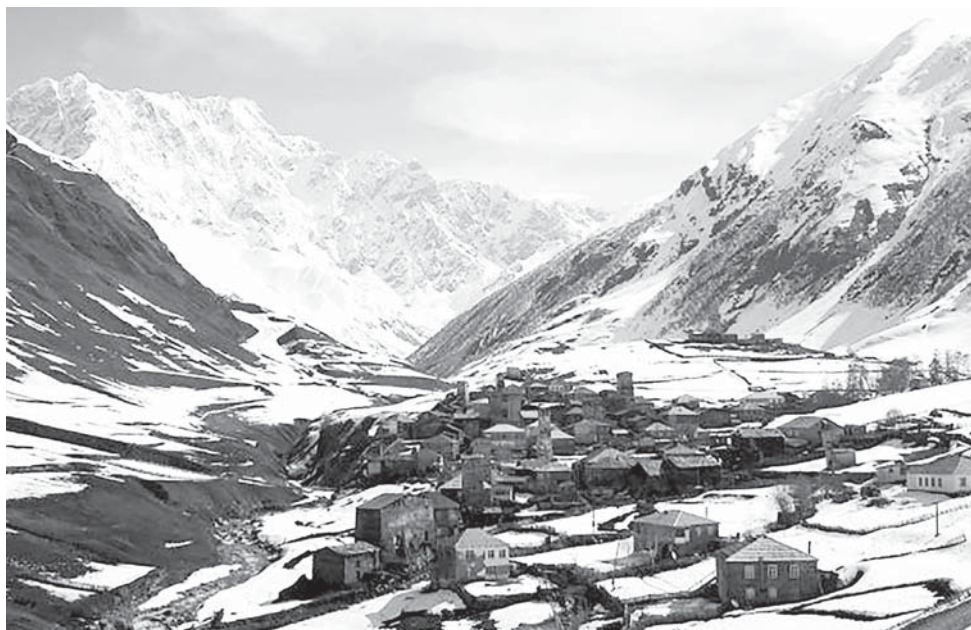
Сванетияда Ушгули элден «Бызынги къабыргъаны» кӛрюмдӛсю.