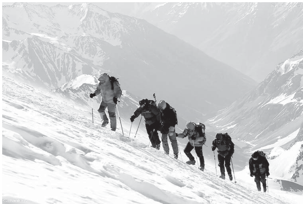
Минги таугъа жол кыйынды.