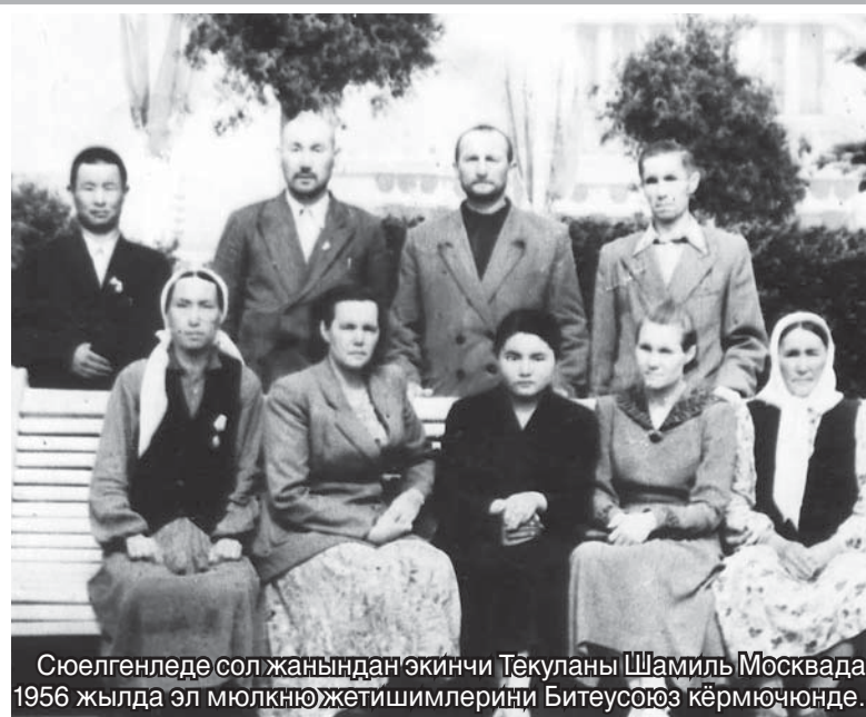
Сюелгенледе сол жанындан экинчи Текуланы Шамиль Москвада 1956 жылда эл мюлкню жетишимлерини Битеусоюз кърмючюнде.

ол жерли адамланы окъуна озгъандыла, юйюрле къррагъандыла, сабийле ёсдюргендиле.