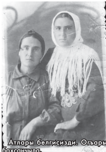
Атлары белгисизди. Огъары бахсанчыла.