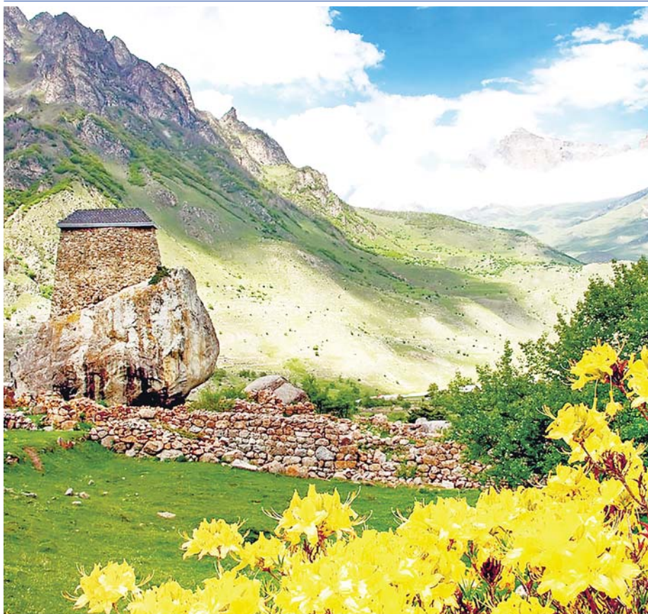
Огъары Малкъар. Бурунгу Амырхан къала.