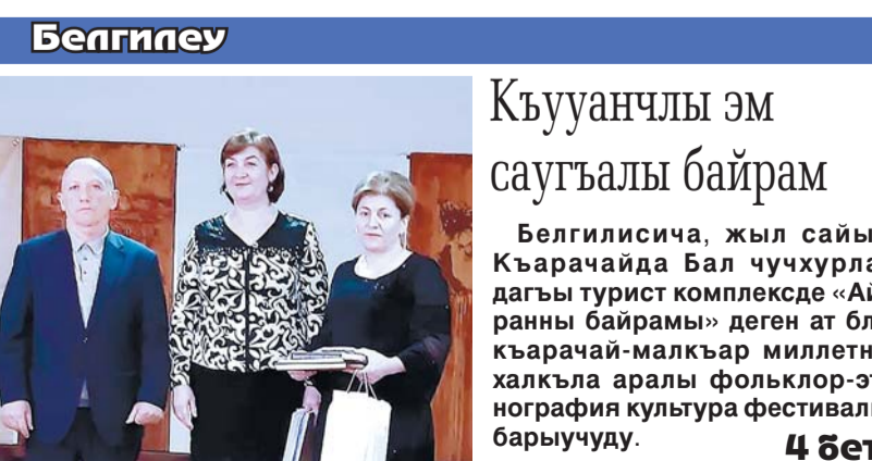
Белгилеу Къууанчлы эм саугъалы байрам Белгилесича, жыл сайын Къарачайда Бал чучурла-дагы турист комплексде «Ай-раны байрам» деген ат бла къарачай-малкъар миллетни халкъла аралы фольклор-этнография культура фестивалы барыучуду. 4 бет