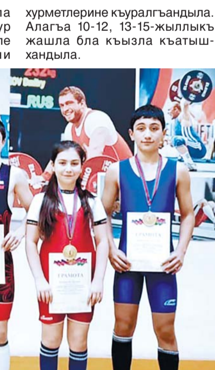
Турнирге Элбрус району Олимпиадала резервлы спорт школуну жаш гѐжефлери да

Краснодар крайны Анапа районуну Сукко элинде ауур атлетикадан ачыкъ эришиуле этгендиле. Ала РСФСР-ни хурметлерине къуралгандыла. Алага 10-12, 13-15-жыллыкъ жашла бла къызла къатышхандыла.