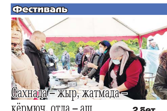
Фестиваль Сахнада — жыр, жатмада — кёрмюч, отда — аш 2 бет