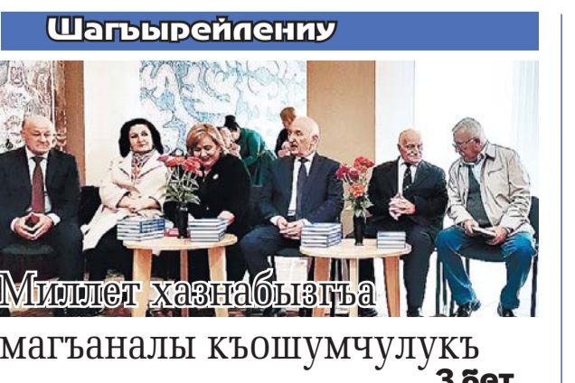
Шагырейлениу Миллет хазнабызга магъаналы къошумчулукъ 3 бет