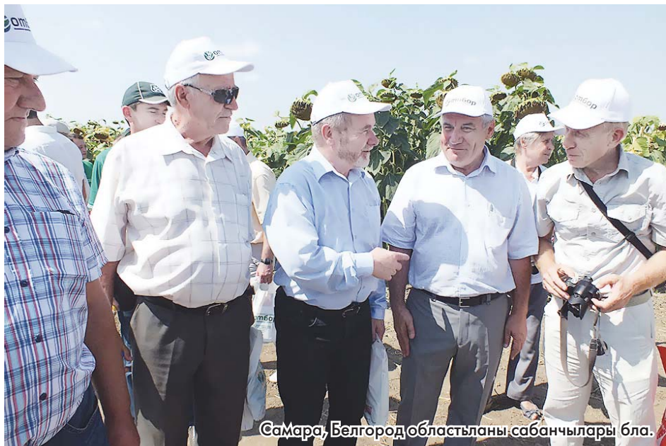
Самара, Белгород областланы сабанчылары бла.