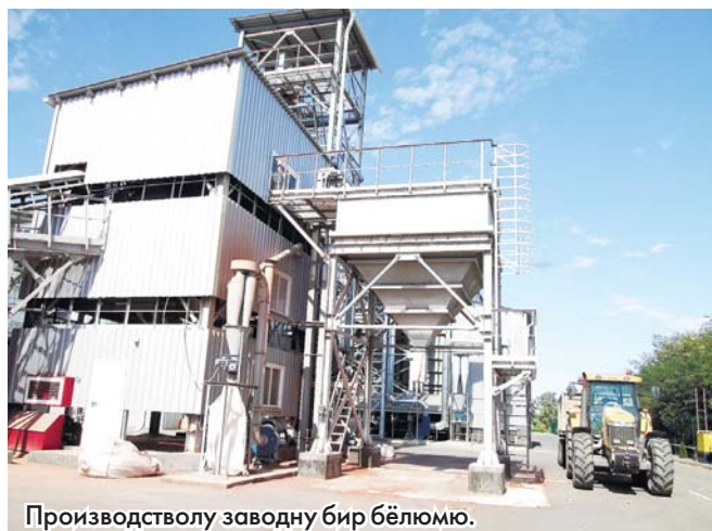
Производулу заводну бир бёлюмю.