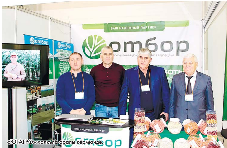
«ЮГАГРО» халкыла аралы кермючде.