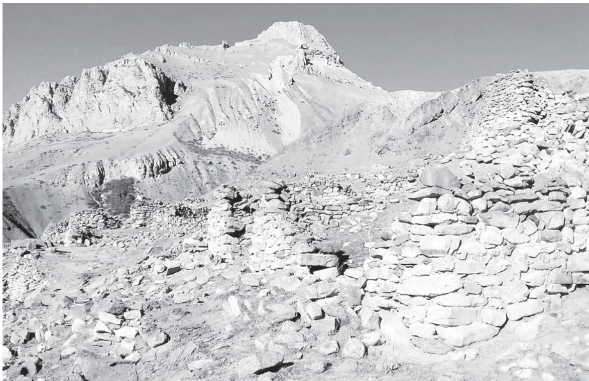
Ачы элни кёрюмдюсю.

Кюна чууакъды. Кёз къама-тады. Жолубуз тикден-тик, ёр сюрем барады. Улоубуз аллай жоллагъа жарагъан