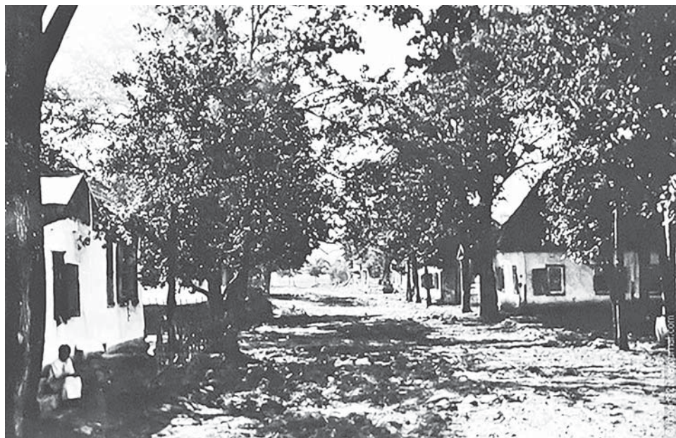
Эски Нальчикни орамы.

Андан сора да, Голицын бизде кегет терек бахчачылыкъны мурдорун салгъанды. Ол затдан ангыламы болгъан усталаны келтирип, мында юйретиу курсла да ачханды. Биринчи тереклени да Нальчик паркда ол салдыргъанды. Иели адамланы араларында эришиуле къурагъанды, кимни терек бахчасы иги болгъанын белгилеп, саугъагъа эки жюз бла жарым кюнюш ахча берирге да айтханды, дейдиле эски жазула, алай ол затны жашауда болдуралмагъанды. Ол кезиуде, 1846 жылда, Шамиль иймамны бу жерлеге келип, мында къонакъбайлыкъ тапханы бла байламлы, анга эркинлик бергенсе деп,