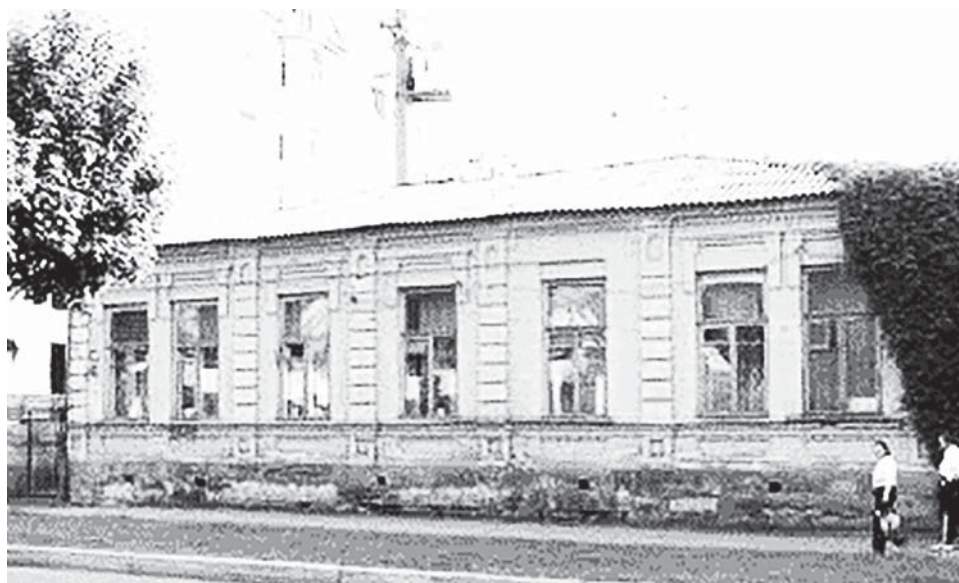
Моллаланы Исхакъны юйю.