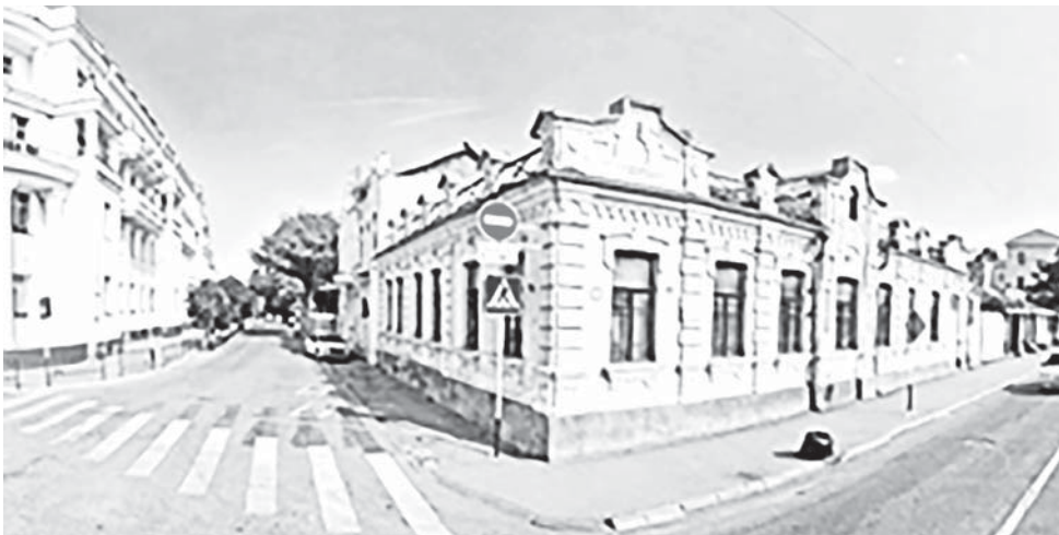
Малкъарукъланы Дадашны юйю.

болгъандыла. Нальчик сууну жагъасындагы аскер бегитиуню тегерегинде отставкагъа кетген аскерчилеге юйле салыргъа эркинлик 1839 жылда берилгенди. Алай бла ол жыл мында, бусагъатда «Победа» кинотеатр тургъан жерден суу таба, аскер къуллукъдан эркин этилген адамладан бир ненча юйюр – бары да бирге жюзге жетмеген адам, жашап башлагъанды.