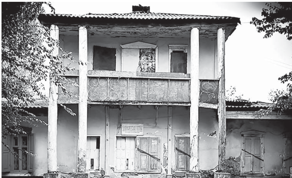
Суворов атлы орамда юй.

1843 жылда килиса (бусагъатда Пятигорск орамда) ызы бла межгит (Кешоков атлы орамда) ишлеп, ары юйюрюгендиле. Килисаны жанында къабырла болгъадыла. Ол кезиуде Россейден Кавказ линияны таматасына Владимир Сергеевич Голицын салынганды. Ол Нальчикде анда-мында орта кюн бардырылуучу базарлары харыйых кюнден бардырыгъа оноу этгени бла белгиледи. Ол базар болуучу жер бюгюнде Къабарты эм Грибоедов атлы орамланы къошулгъан жерлериде дейдиле, «Победа» кинотеатрны къатында. Аны алай болгъанына ол Грибоедов атлы орамгъа алда Гитче базар орам, алайгъа Гитче базар майдан деп атагъанлары шагъатлыкъ этеди.