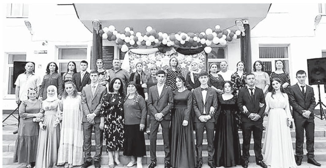
Устазланы бла оқыучуланы къаууму.