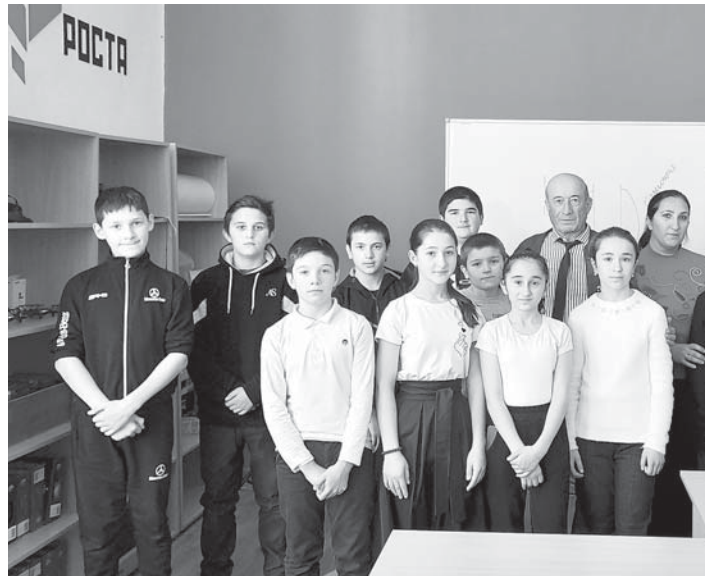
«Точка роста» арада.

хазырлагъанларын жюри бек жаратхан эди эм гранприни алагъа бергенди.