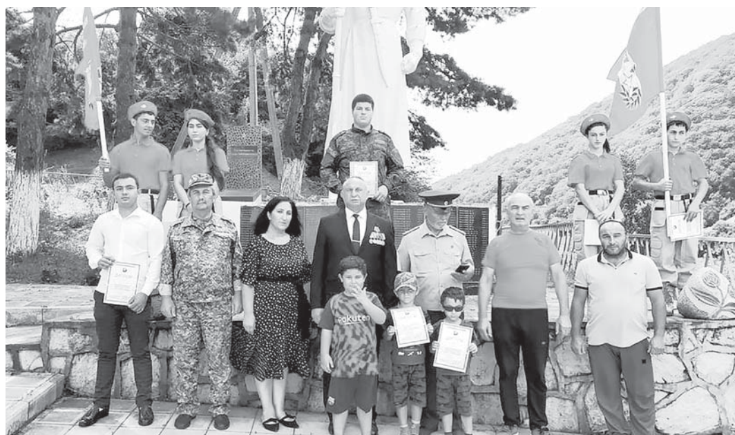
Уллу Ата журт урушну жигитлерин эсгере.

мадарла да этиледиле, профилактика мероприятяла, специалистле бла тубешиуле кыралладыла.