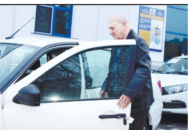
Иш юсюнде ачып, къыу тапханладан экеуленге Социал страхованияны фонду регион бёлуюноде «Лада-Гранта» машиналадан ачычланы къуанчы халда бергенди.

Иш юсюнде ачып, къыу тапханладан экеуленге Социал страхованияны фонду регион бёлуюноде «Лада-Гранта» машиналадан ачычланы къуанчы халда бергенди. Автомобильле энчиудиле, иелерини саулуларына келиширча этилгенди.