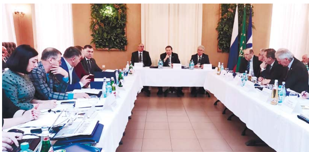
Жыйылыуу къыйматлы боллугуна эмда кеп магъаналы ишлени юсюнден

Тышындан да кёлле келгенди, аланы араларында Россейни кеп регионларында, Германияда, Израильде, Тюркде, Иорданияда «Адыгъ хасэ» жамауат организацианы эмда маданият араланы келечилери да бар эдиле.