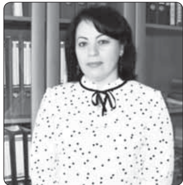
джа, Аргудан жылэм дэт курыт школ №2-м.