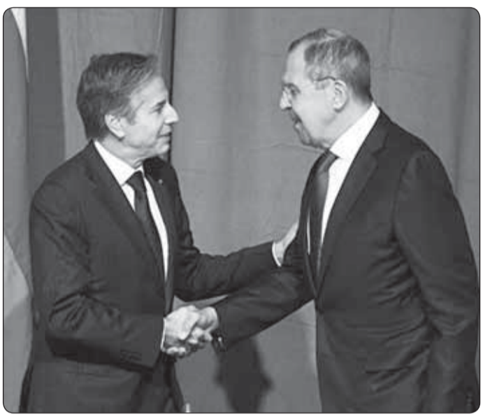
Лавров Сергей кытри- гъазурэ жей Украинэм теуэну Урысейм зезымы- гъэхьэзыр, ауэ США-м и унафэм шцэт НАТО-м и ра- кетэхэр дт гунэгъуэ кэрал- хэм кызырригүашэр имыльгаууи фэ зырызы- тримыгъуэуфунур. Уры- сейм Америкэм лиубыдир жыр псалъэхэм иохуэ: «НАТО зыгуэхъыгъэм кы- кыплэмкэ зевмыгъуэ- бгъуэ».

Политикэм епха хьыбар псори иужьрей зманым зэкүэлэжыгъуэ иушцэ: «Урысей Украинэм теуэну?» Цыху цыкүр зауэм кырагъэлын мурад флэкиа, нэгъуэщ иуэху зезымыхуэ хуэдэу зыкъызыгъэ- лъагъуэ США-м и гупык- киз, шышылым и 21-м Же- невэ цызэхуэзэщ УФ-м нэгъуэщ кэрал Луэхуэ- хэмкэ и министр Лавров Сергейр Америкэм и Штат Зэгүэтхэм я кэрал секретарь Блинкен Энто- нирэ.