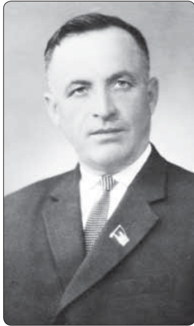
къуажэм кэкуауэ зэрыщытар. Ар кыщыцхуэр 1964 гъэм и шыщхэулуэри. Адыгэ хэкум и тхыдэм кыххэнащ а кыжыкыуэ-щцэ гуапэр.

1959 гъэм и къуажэм кыгъэзэжри, Лениным и ццэр зыжхэ колхозым и пашэ аргуэру хуащ. Ар абы щылэжыащ колхозым хуабжыуэ зригъэуажыащ, езыми пщцэшхуэ зыхуащцэу и Иэнатцэм пэрытащ. Нартыху гъэццыхуэм псоми ятэкуэрт Аскэрбий. Хэкум и мызакъуэу, зырыкэралу ццэрылуэ щыццыхуэ Беданокъуэр. Абы и щыжхэтщ КПСС-м и ЦК-м и япэ секретару, СССР-м и Министерхэм я Советым и тхэмадэу щыта Хрущевыр, я лэжыкыуэ-фым, псэуццэхуэ зыщыгъэ-гъуэзэну, ар къэрал псом щапцэхэ яхуищцыхуэ, Хуэдэ адыгэ