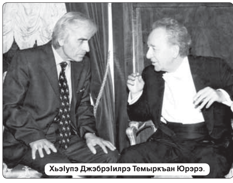
Хьэлупэ Джэбрэилрэ Темыркхан Юрэрэ.

ХьэцІыкІу Раисэ, егъэджакуэ, «Адыгэ дуней» лъэкпэ фондым и къызгъэпэщцлэуэ.