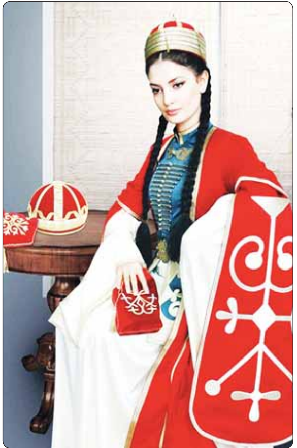
Хамэ цыхухъуэ здэтлыс лэнэм цыхубз ядэтлысыртэкъым, ядэшхэртэкъым. Ядэшхэн дэнэ къэна, лэнэм хьэщцэ шысмэ, цыхубзхэр шцлэкырт е мытлысу ящхьэщцэрт, шхэн яухыху. КЪАРДЭНГЪУШЦІ Зырамыку.

Адыгэ хабзэкэ, зы унагъуэм цыхухъурэ цыхубзэр зэрихьэллэуэ зэхьэщцэгу хуамэ, зэнэлъасэу шымытмэ, зэдэуэршэрыну, зэдэшхэну хабзэтэкъым. Ар кызыхьэкыр цыхухъумрэ цыхубзымрэ зэхуалэ нэмысыр арат. Ауэ хьэщцэхэр шцалэ зи къэшэгъуэрэ хьыджэбз зи ишэгъуэу шытмэ, а тлур зэра-гъэцыхурт, хгъэррей зэхуащцэрт, зэдэ-гъуэршэрырт.